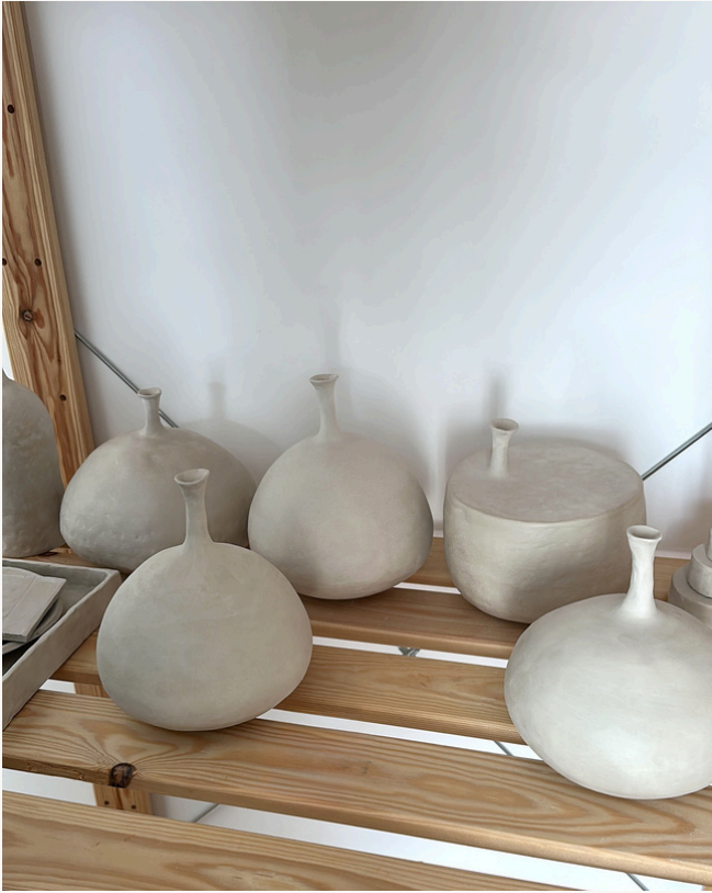
Séchage des formes