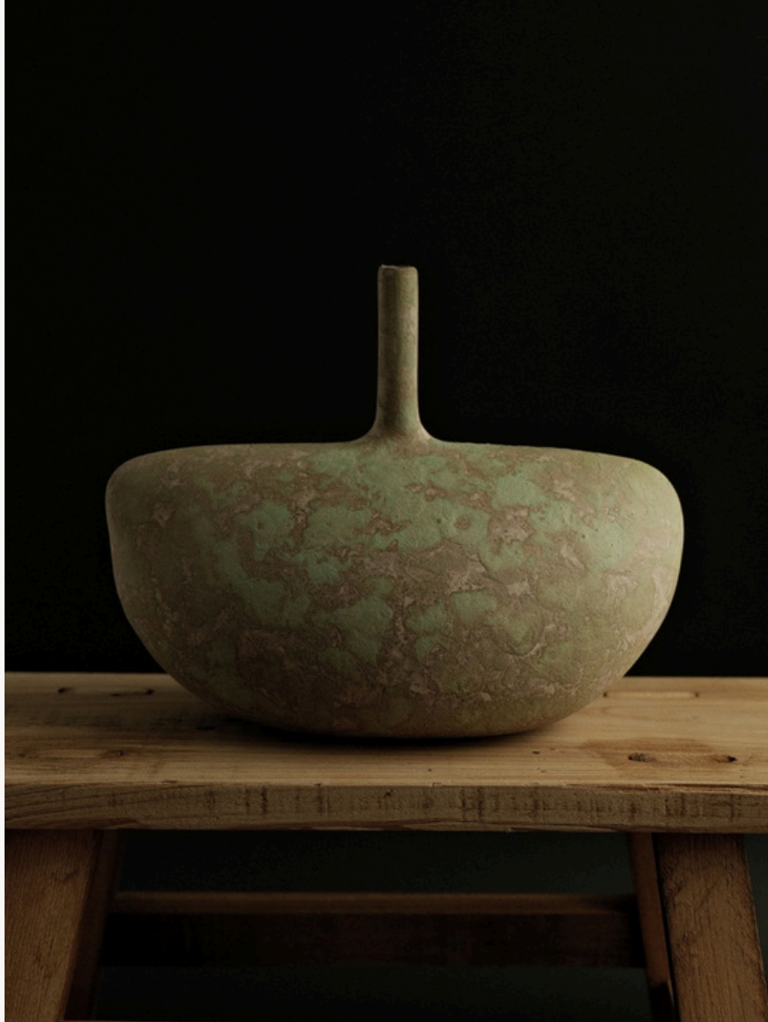
Sans titre Grès, façonné à la main (technique du colombin) Oxydes minéraux naturels Cuisson haute température 15 cm H x Ø 48 cm Pièce unique — 2025