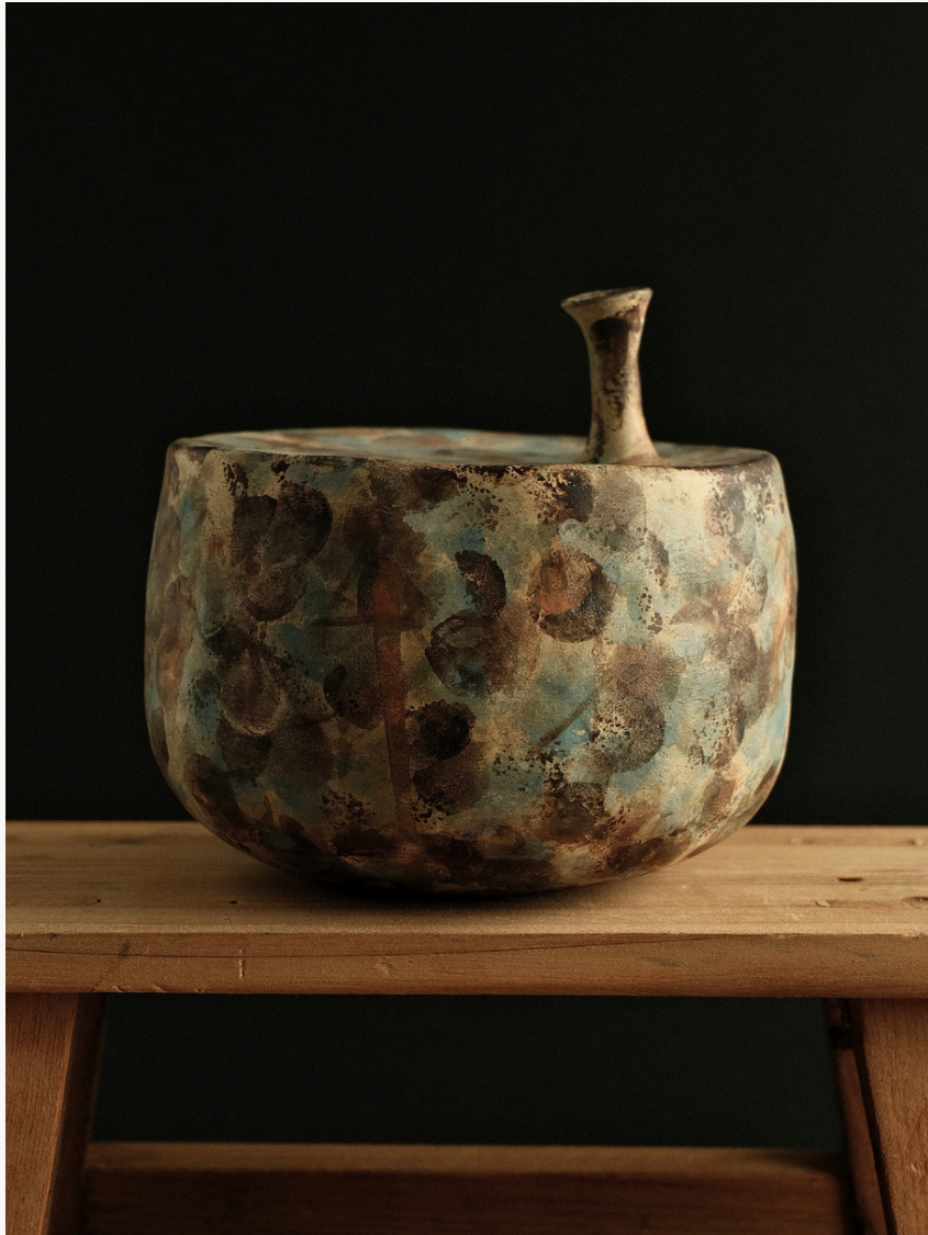
Sans titre Grès, façonné à la main (technique du colombin) Oxydes minéraux naturels Cuisson haute température 16 cm H x Ø 47 cm Pièce unique — 2025